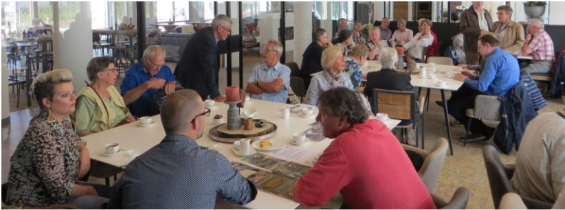
18 juni voorafgaand aan de wandeling voor donateurs

Voorafgaand aan deze wandeling was er een lezing over het herstel van de dakkapellen en de zwerftocht die deze kapellen in de loop der eeuwen hebben gemaakt. De belangstelling was wederom groot, niet alleen bij u als onze donateurs maar ook bij anderen.