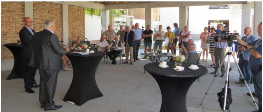
Uitreiking Erfgoedprijs Zwolle-Kampen op 8 september 2016 (Open Monumentendag)

Een belemmerende factor is de communicatie met de gemeente Kampen. Op vragen, brieven etc. komt niet of slechts af en toe een antwoord. Het aantal onbeantwoorde brieven is in 2016 opgelopen. Aandacht voor dit onderwerp was bij de gemeente niet aan de orde.